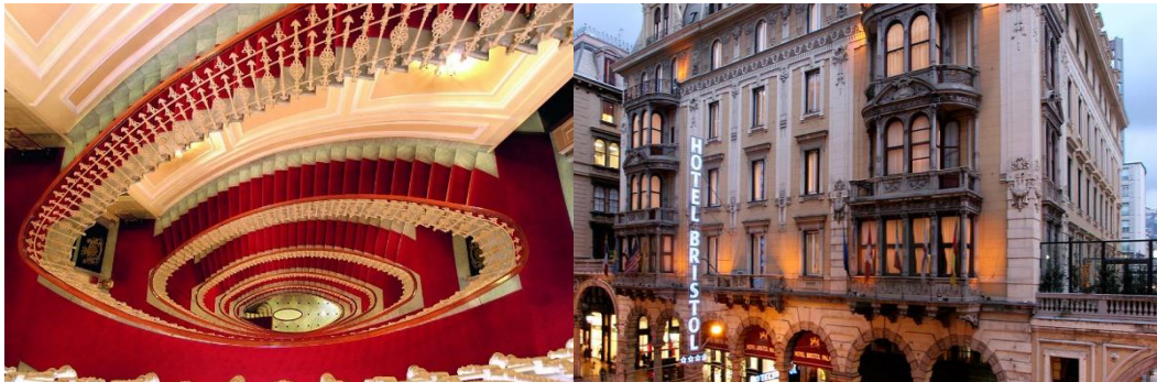
Het Bristol Palace Hotel ****

Nadien nemen we een laatste lunch in het kelderrestaurant I Squarciafico. Later op de middag (om 15.00uur) wacht de bus ons op aan het hotel en brengt ons terug naar Milaan-luchthaven. Vertrek Milaan :18.50uur met aankomst in Brussel om 20.20uur. (Vlucht SN 3150)